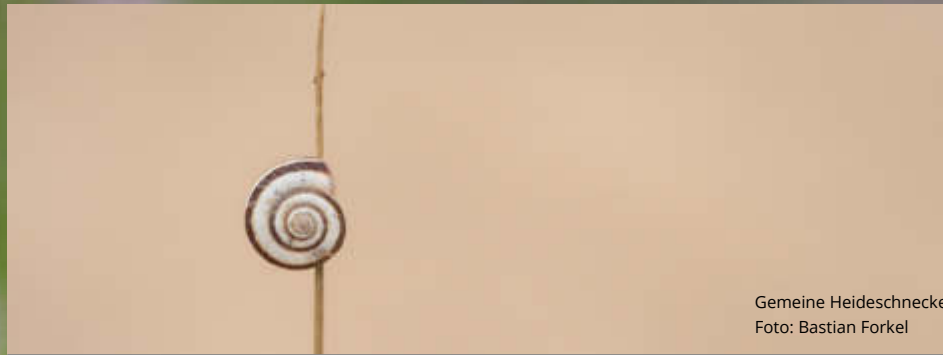
Gemeine Heideschnecke